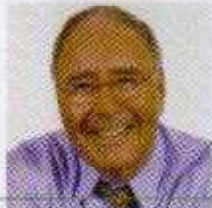
par Jean-Marc Chaput Auteur et conférencier