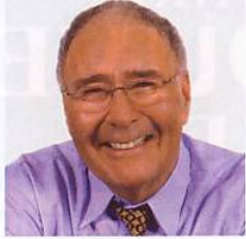
par Jean-Marc Chaput